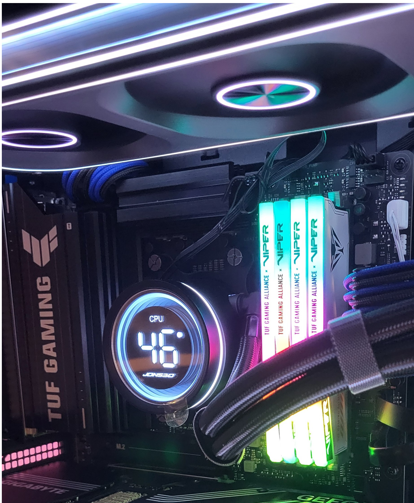
Wydajna płyta główna Asus TUF GAMING B760-PLUS WIFI AM5 4DDR5 z PCIE 5.0